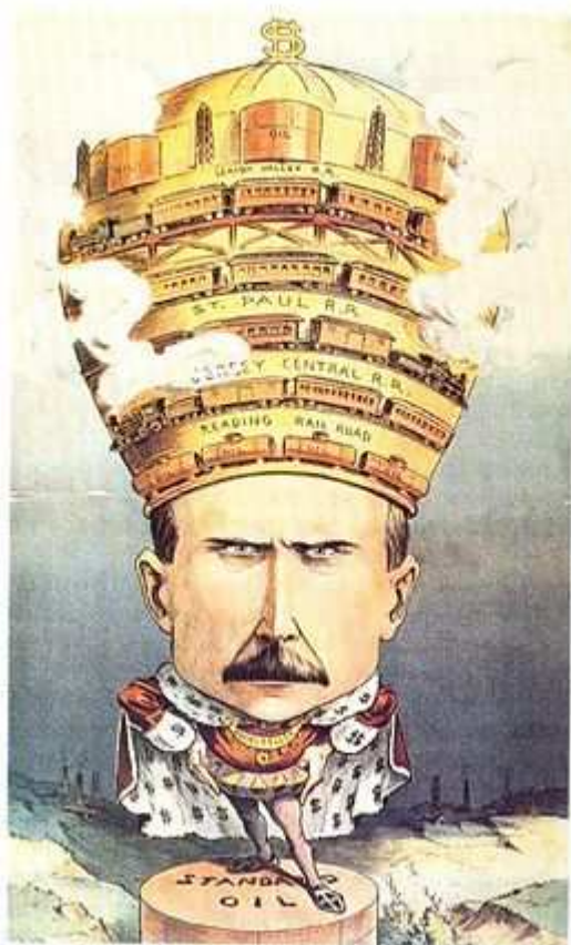
John D. Rockefeller, satirized in a 1901 Puck cartoon, is enthroned